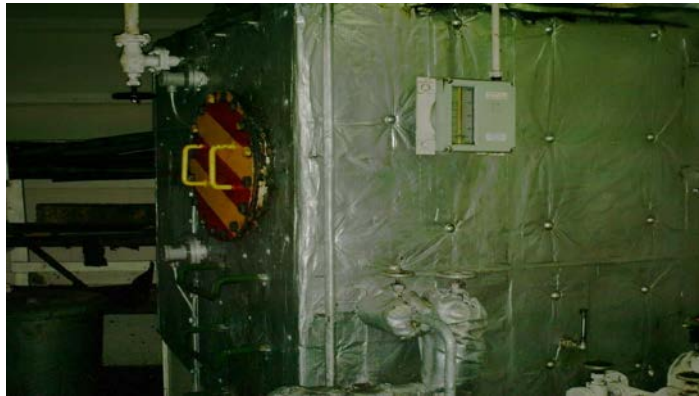
Gambar 2: Waste Oil Settling Tank di KM Tanto Bersama

disebabkan karena berat jenis minyak masih tinggi dan titik bakar minyak masih tinggi pula sehingga untuk membakar minyak tersebut memerlukan panas yang banyak, oleh karena itu waktu pembakarannya menjadi lebih lama. Dengan pemanasan diharapkan agar minyak bekas dapat dibakar secara sempurna. Berikut disajikan Waste Oil Settling Tank di KM Tanto Bersama