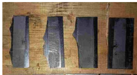
Gambar 2. Carbon Blade

Carbon blade yang telah aus, hal ini menjadi salah satu penyebab dari rendahnya tekanan udara yang dihasilkan oleh aeration blower pada sewage treatment plant , karena carbon blade adalah komponen dalam aeration blower yang memiliki fungsi sebagai penghisap dan pendorong udara dari sekitar dan menghasilkan udara bertekanan. Keausan pada carbon blade disebabkan oleh carbon blade yang secara terus menerus bergesekan antara carbon blade dan body motor penggerak pada aeration blower selama beroperasi.