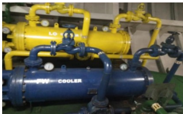
Gambar 2. Fresh Water Cooler

Cooler yang berfungsi untuk mencegah terjadinya panas berlebihan ( overheating ) melalui proses pendinginan suatu fraksi panas dengan menggunakan media cairan dingin, sehingga akan terjadi perpindahan panas dari fluida yang panas ke media pendingin tanpa adanya perubahan suhu. Pada saat pengambatan terjadi penyumbatan pada cooler atau lubang-lubang didalam fresh water cooler (gambar 2) yang disebabkan karena lumpur atau kotoran yang mengendap pada beberapa lubang yang berakibat salah satu dari lubang akan mampat sehingga peran air laut untuk mendinginkan air tawar tidak optimal. Sehingga dalam mengatasi masalah ini, dilakukan upaya dan perbaikan karena penyumbatan pada lubang cooler dengan cara buka cover cooler kiri dan kanan kemudian sogok lubang-lubang cooler dengan rotan sampai lumpur atau kotoran-kotoran yang ada didalam lubang bisa keluar setelah itu bilas dengan air bertekanan agar sisa kotoran bisa keluar semuanya, pasang kembali cover cooler .