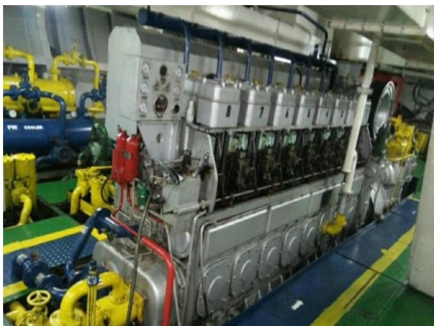
Gambar 1. Main Engine MV. Sainty Governor